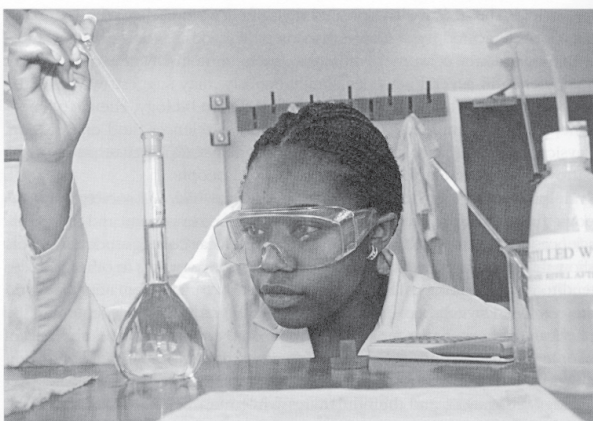
A medical student makes up a solution in a laboratory.