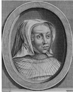
18de eeuwse gravure Margareta van Oostenrijk.

Margareta bleef na het mislukte complot ook niet volharden in de boosheid. Ondanks haar loyaliteit aan het huis van York, was ze verstandig genoeg om zo snel mogelijk de goede verstandhouding en vooral de handelsverdragen met het Engelse hof te herstellen.