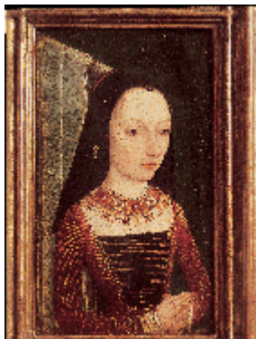
Portret van Margareta van York. Anoniem, Musée du Louvre, Parijs

Margareta van York was op politiek vlak ondernemender dan van haar verwacht werd. Zij nam in afwezigheid van haar man vaak de politieke beslissingen. Samen met stiefdochter Maria zat ze twee vergaderingen van de Staten-Generaal voor om geld en troepen te vragen voor de talrijke krijgstochten van Karel de Stoute. Na zijn dood in 1477 stond ze voor de moeilijke taak de rust in het Bourgondische rijk te bewaren.