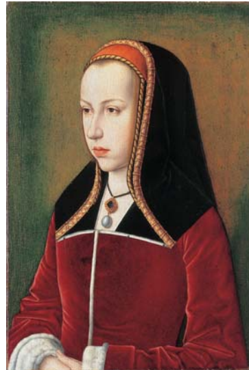
Margareta van Oostenrijk als jonge prinses.

Sinds 17 september viert Mechelen 'Stad in vrouwenhanden' een cultuurproject met tentoonstellingen, podiumkunsten en feestelijke activiteiten. Mechelen 2005, Stad in Vrouwenhanden vertrekt van de interactie van de twee leading ladies van vijfhonderd jaar geleden, Margareta van York en Margareta van Oostenrijk, met de stad. En meteen is de opzet van het tentoonstellingsproject Dames met Klasse duidelijk. Wie zijn die twee Margareta's en hoe leefden zij? Beiden hadden het een tijdje voor het zeggen in onze gebieden. Hoe groot was de macht van vrouwen toen?