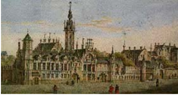
Het oude hof van Kamerrijk, paleis van Margareta van York

Voor Margareta van Oostenrijk was het dankzij het nieuwe tijdsgewricht mogelijk om ook buiten de grenzen van het religieuze te treden. Zij gaf dan ook blijk van een brede interesse in de kunsten. Ze hield van literatuur en muziek, ontving graag en veel filosofen aan haar hof en leidde verschillende bouwwerken. Het waren vermoedelijk haar eerste jaren aan het Franse hof die aan de oorsprong lagen van een levenslange passie voor kunst en muziek. Eens terug aan het hof in Mechelen zorgde Margareta van York ervoor dat ze haar opvoeding in kunst en muziek kon voltooien en kwam ze in contact met het prehumanistisch gedachtegoed van onder andere Rudolf Agricola.