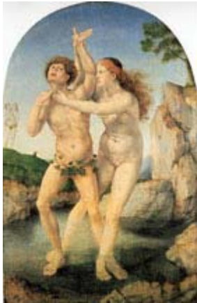
Hermaphroditus en Salmacis Beeld uit de tentoonstelling: Hermaphroditus en Salmacis van Jan Gossaert, Museum Boijmans van Beuningen, Rotterdam

Ook al wordt de politieke rol van Margareta soms gerelativeerd, de meeste historici zijn het wel eens over haar belangrijke rol als mecenas van kunst en kunstenaars in haar tijd. Binnen de kunstgeschiedenis wordt haar mecenaat gezien als een belangrijke schakel tussen de laatgotiek en de vroegrenaissance.