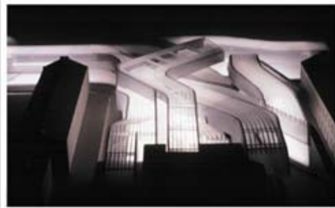
Ontwerp Museum van Moderne Kunst, Rome

De projecten die ze wel kon realiseren genieten internationale bewondering. Het Vitra-brandweergebouw in Duitsland bijvoorbeeld of het museum voor moderne kunst in Rome. Voor de parkeergarage (in de vorm van bliksemschicht!) met aansluitend tramstation in Straatsburg kreeg ze in 2003 de Mies van der Rohe-prijs van de Europese Unie. Momenteel werkt ze aan projecten in Frankrijk, Italië, Duitsland, Spanje, Taiwan en de Verenigde Staten.