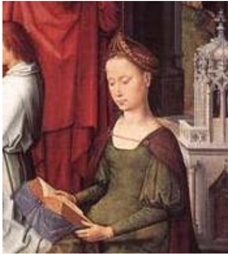
Margareta van York als de Heilige Barbara. Detail uit de triptiek Johannes de dooper van Hans Memling 1474-79. St.- Janshospitaal, Brugge